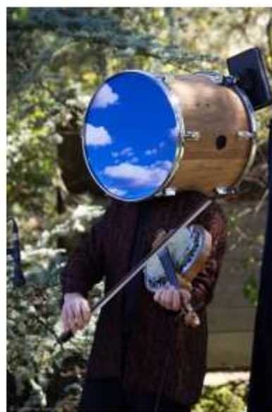
Cavalcade en Cocazie