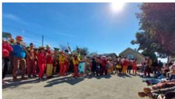
Fanfare Tonnerre de Brens