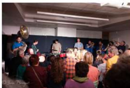
Le Grand Tabazù