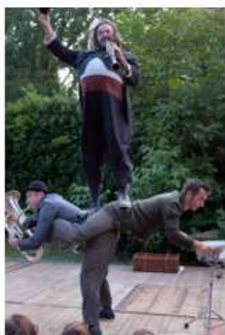
Cirque Cie Téatro necessario

Cette année encore, cette balade dans les jardins et les rues du village fut une réussite totale. Un public enchanté par la variété et la qualité des propositions... Du rire, des émotions et des rencontres en tout genre, quel souvenir !!!